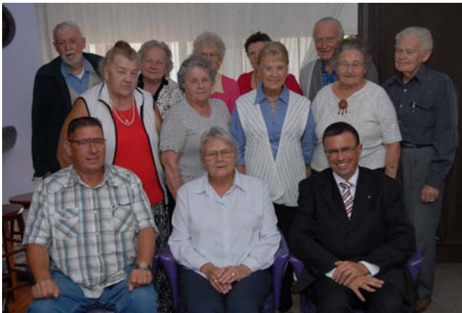
Draudzes seminara dalībnieki