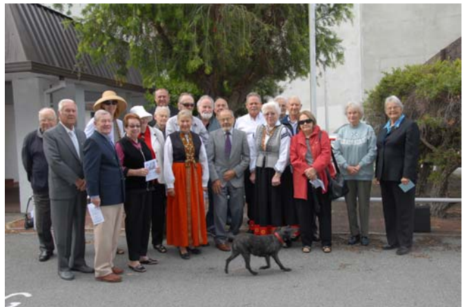
Pertas latvieši 18. novembra rītā