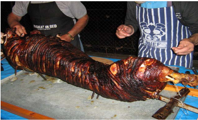
Cūka gan bija branga un pietika visiem un vēl pāri palika.