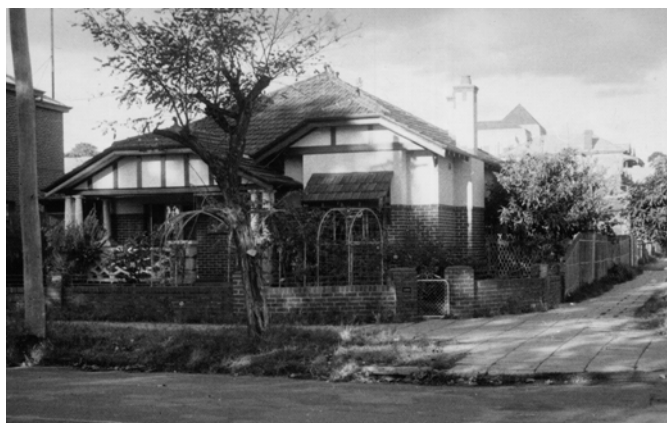
Draudzes māja Bennet ielā

„Vecākā” paaudze varētu daudzās šinīs atmiņās dalīties, atskatoties uz mūsu kopīgām gaitām Pertā. Skatoties tā laika fotogrāfijas, starp priekiem, ko baudījām draudzes eglītēs, izbraukumos, nometnēs, svētdienas skolas sarīkojumos, vecgada ballēs un svinīgos aktos, arī nobirst kāda asara par aizgājušiem draugiem un paziņām.