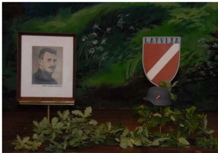
Kalpaka un Latviešu leģiona atceres Pertā, dekorācijas.