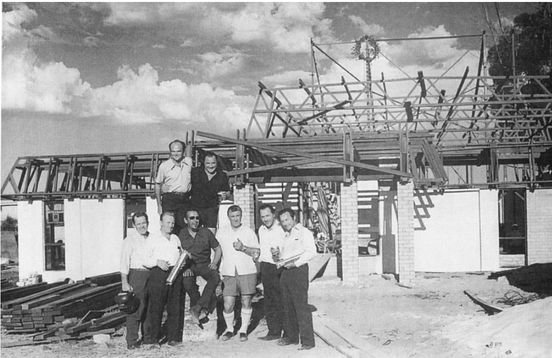
Sienas uzceltas, var svinēt Spāru svētkus

mūsu kopienas uzturētājs. Jo bez tā, mēs jau būtu izklīduši. Savs kaktiņš, savs stūrītis zemes ir tomēr mūs turējis kopā.