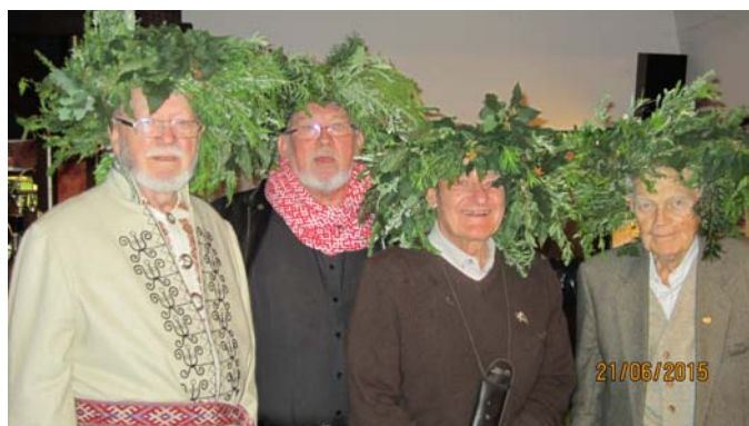
Jāņi – foto: J. Purvinskis