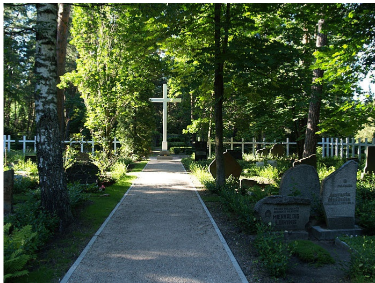
Meža kapu "Balto krustu" kapulauks baigā gada un Gulaga noņemtu upuru piemiņai.

Kungs, Visuvarenais debesu Tēvs – Piemini Latviju.