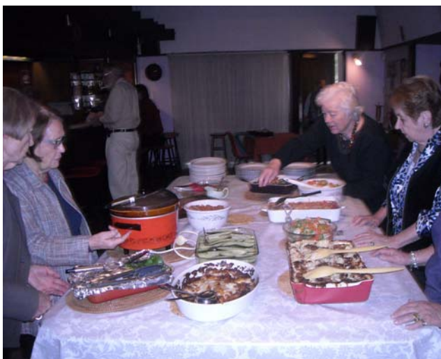
Vispirms Vanadzēs mūs pabaroja

Pirms vēl filmu sākām skatīties Ritiņa mums īsumā atgādināja kāpēc Centrs vispār radās: kad mazā Bennet ielas zālīte kļuva par mazu, bija jāmeklē cits atrisinājums. Zāle bija par mazu, jo teātrim vajadzēja skatuvi, un ja tur liktu skatuvi, tad publikai nebūtu kur sēdēt. Arī kora koncertiem bija tā pati nelaime, un pat 18. Novembra svinībām mūsu latviešu skaits bija vienkārši pāraudzis zāles lielumu. Visas Pertas latviešu organizācijas sanāca kopā un nolēma, ka ir jāceļ pašiem sava 'Pils', kur