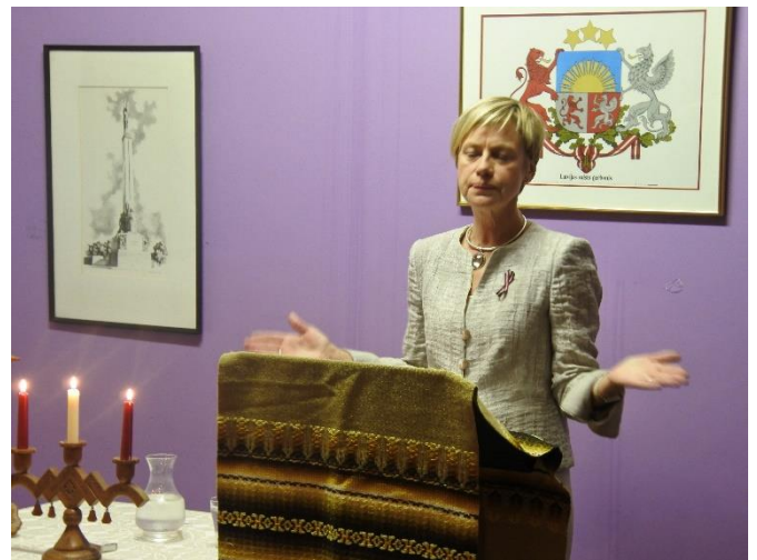
Viesu runātāja Sarmīte Ēlerte.

Tūlīt pēc 18. novembra un siltajā, saulainajā trešdien 23. novembrī mūs apciemoja Valsts Svētku runātāja no Latvijas, Sarmīte Ēlerte ar savu svētku referātu: “Gribo, Ticība, Rīcība”. Bija saradies negaidīti lielāks ļaužu pulks nekā, nupat pēc notikušajām valsts svētku svinībām, bija sagaidīts.