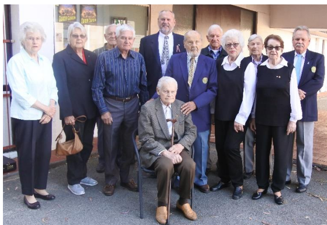
Dalībnieki karogu uzvilšanā.

Tā nu piektdienas rītā jau pirms septiņiem no rīta pie Pertas Latviešu Centra sāka lasīties Pertas latviešu saime. Esam paraduši šo gadījumu noturēt precīzi laikā, jo kad vēl dažiem bija jātiek darbā tad, to varēja paspēt. Tā nu pulksten septiņos, ieskaņotajām tauru skaņām skanot, Latviešu Centra karogu mastos, caur Daugavas vanagu drošajām rokām un vanadžu pavadībā, lēni uzvijās Latvijas sarkanbaltsarkano krāsu karogi.