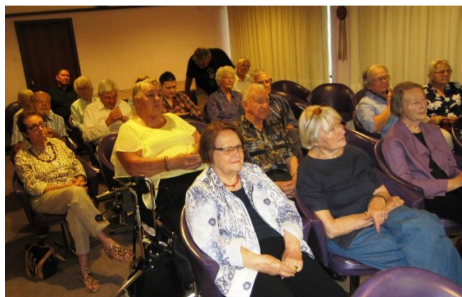
Pertas latvieši noklausās Sarmītes Ēlertes referātu, 23. novembrī.