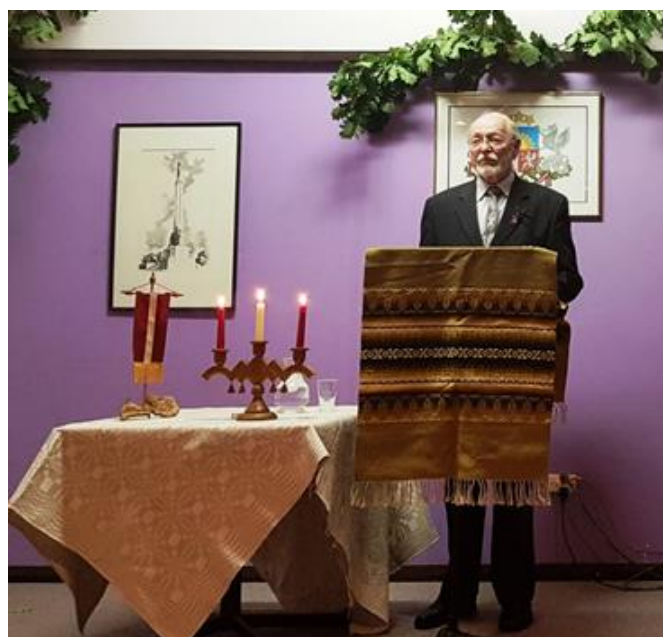
Latvijas Goda konsuls Pertā, sniedz Svētku runu.