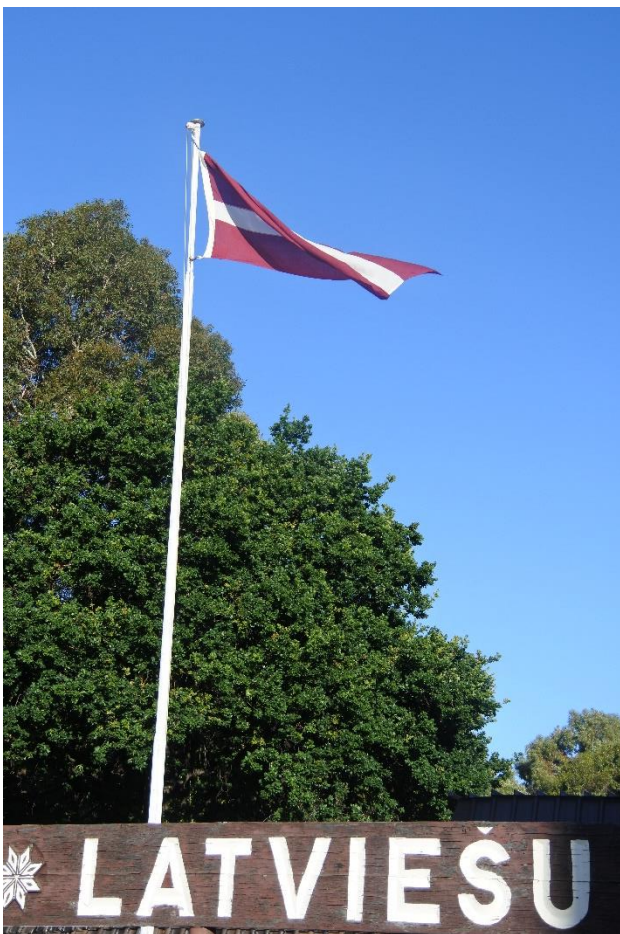
Latvijas karogs virs Pertas Latviešu Centra

mums atgādināja mūsu cīņu par Latvijas valsts neatkarības atgūšanu un arī mūsu sāpes par atdzimušo valsti, kuru mēs vairs nepazinām, jo tā nebija tāda, kādu mēs bijām cerējuši un ka vēl šodien tā ir pilna krāpnieku un neģeļu kuriem tikai interesē sava kabata, bet nē valsts. Viņš arī atgādināja par to tautas vienotību kura izpaudās pirmajās brīvības alkas dienās un pie barikādēm stāvēt sargājot savu jauno valsti. “kur ir tie patrioti palikuši šodien?” jautāja konsuls. Tālāk viņš pievērsās tam, ka kaut gan skaitā esam maza tauta, tomēr mūsu diasporas izkaisītajai tautai arī liels spēks, jo mums ir gudri, zinīgi cilvēki, kuri ir spējīgi valstij palīdzēt. Mūsu šīsdienas Pasaulē nekrīt svarā, kur tu esi, caur internetu vari būt, kur vien gribi un vari darboties un valstij palīdzēt augt. Arī jaunie latviešu emigranti, kuri ir tādi paši bēgļi, kādi bijām mēs, jo arī viņi brauc prom, tikai kā Sprīdītis, meklēt labāku dzīvi. Un tomēr mēs visi esam latvieši, dzimtene mūs sauc un vienmēr sauks. Latvija ir mūsu dzimtene, jo citas mums nav. Viņš beidza savu uzrunu ar velējumu, lai latviešu tauta apzinās savus pienākumus ko tiem uzliek esot par Latvijas pilsoņiem un mums visiem, kur vien atrodamies, ir jādara visu ko varam lai” Latvija zaļo un zeļ!”