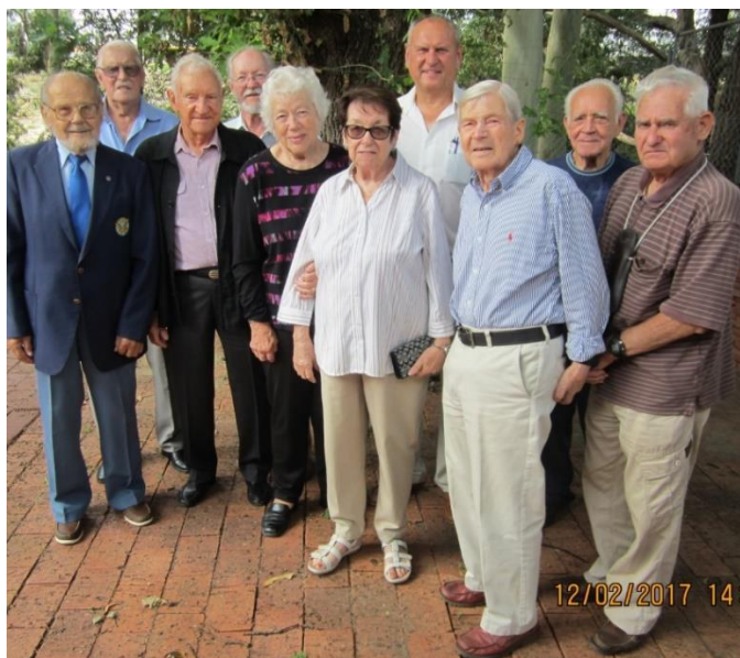
DV Pertas nod. valde 2017.g.