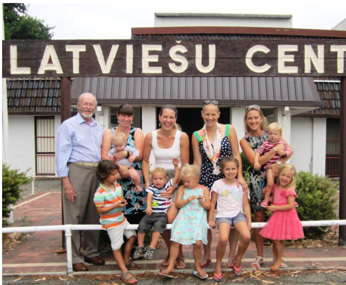
Latviešu bērnu spēļu grupa: Zīlūks, Pertā. (bildē trūkst vēl divas māmiņas un 2 bērni) Pirmā diena.