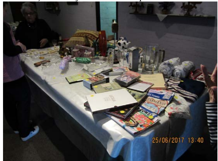
Bija arī tirdziņš