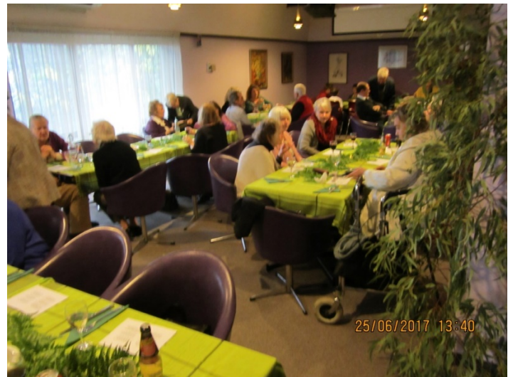
Jāņubērni bija saradušies kuplā skaitā